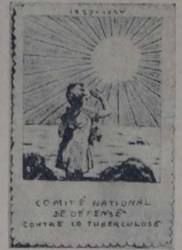
LA ESTAMPILLA ANTITUBERCULOSA "BESO AL SOL"

Esta acción particular, que se concreta en organizaciones antituberculosas, obtiene sus recursos directamente del público, mediante actos de propaganda y